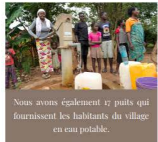
Nous avons également 17 puits qui fournissent les habitants du village en eau potable.

Pour ce qui est du centre communautaire que nous avons construit avec la FIFA, nous impactons plus de 5000 personnes par an avec entre autre des programmes de maths et d'alphabétisation gratuits mais aussi un programme d'agriculture dont les produits vont directement à notre cantine.